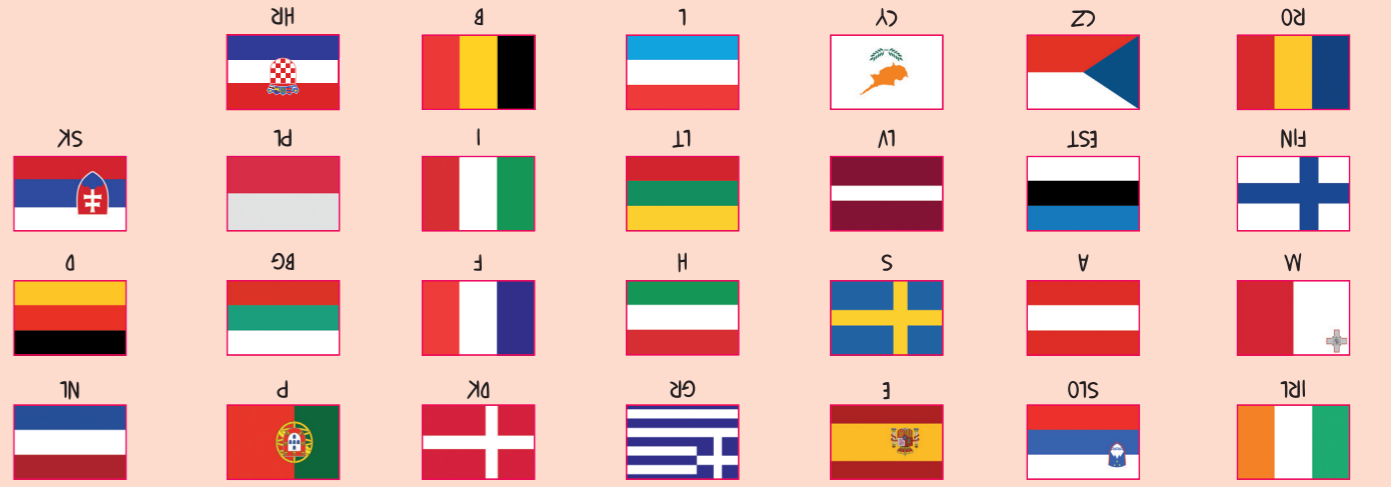
WISSEN MACHT SPASS (SEITE 26-27)