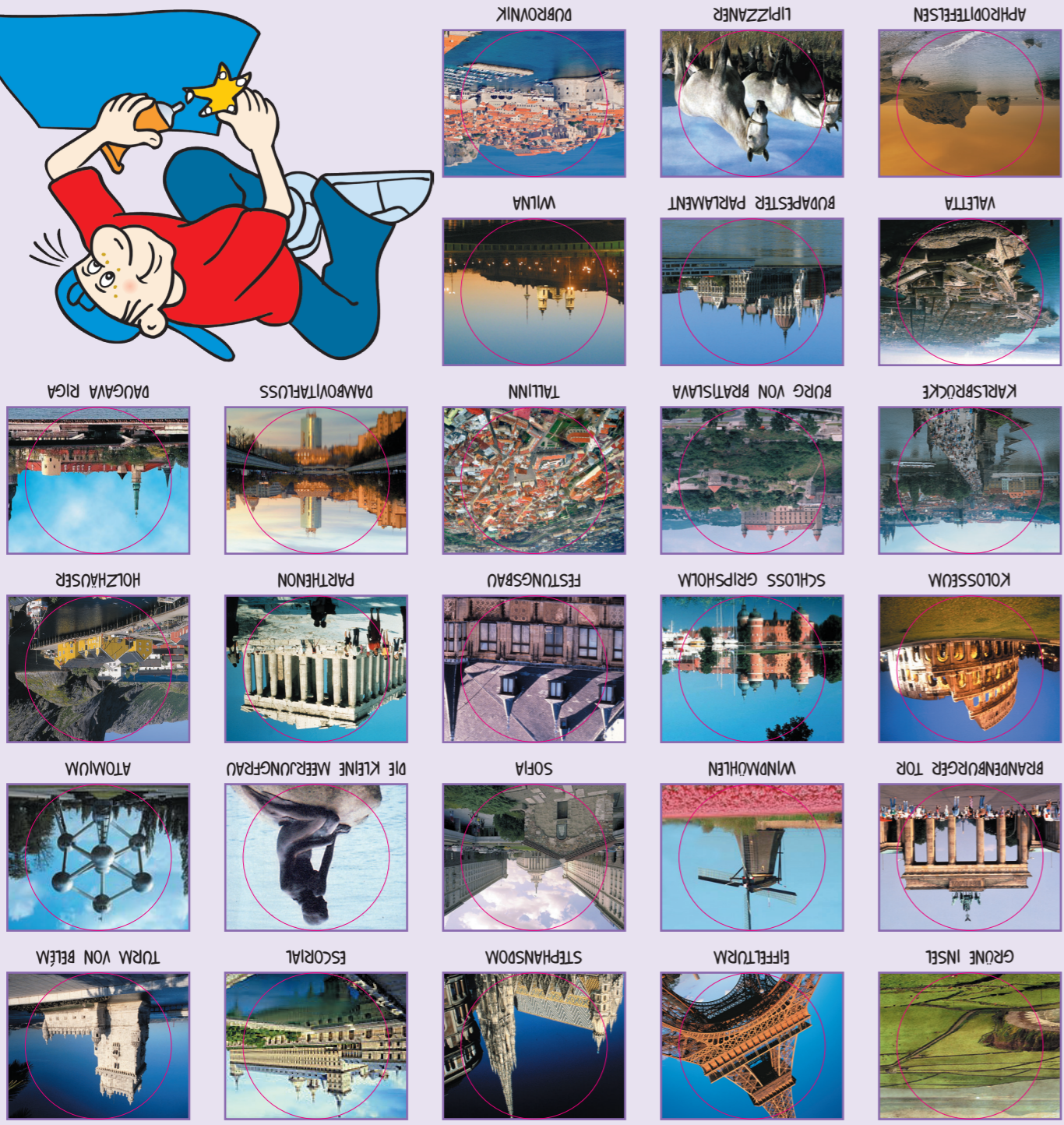
STARKE WURZELN (SEITE 30-31)