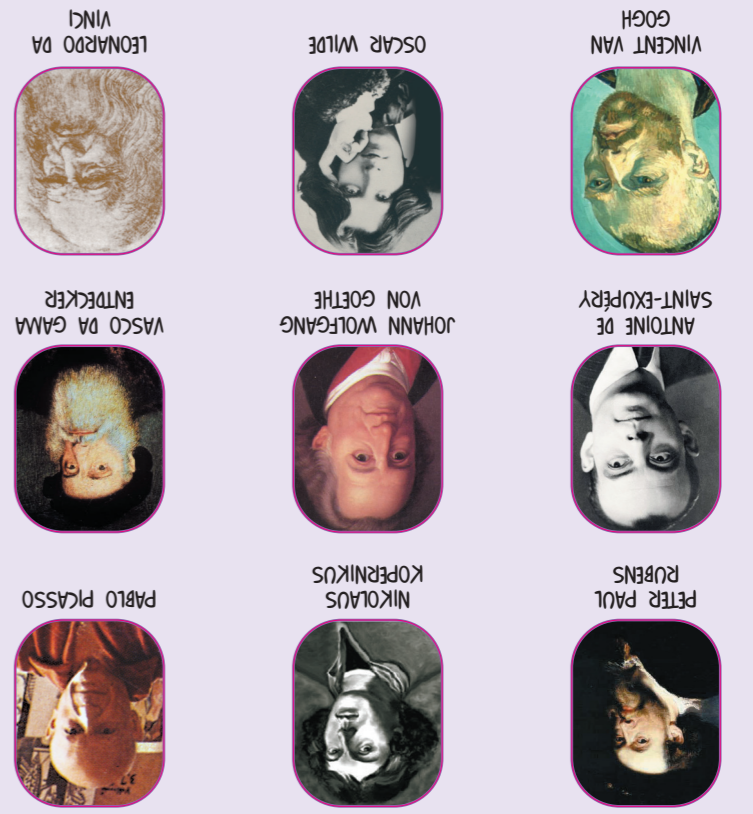
DIE HELLSTEN KÖPFE (SEITE 33)